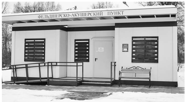
ФАП в селе Чернышено.