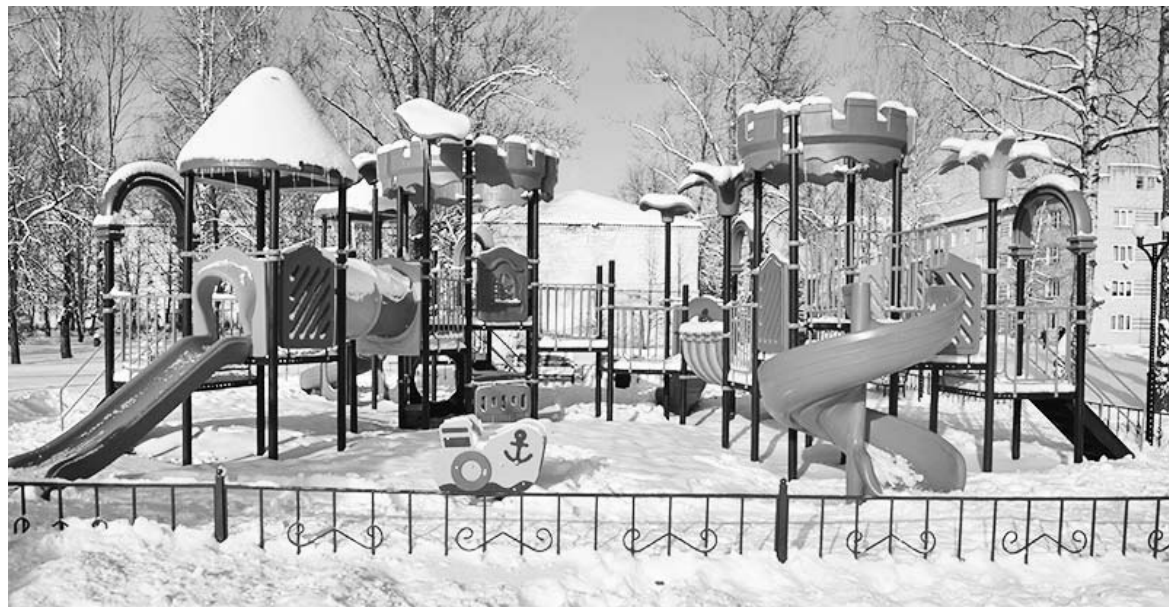
Детская площадка в с.Новослободск.

Текст доклада и слайды к нему размещены на сайте МР «Думиничский район».