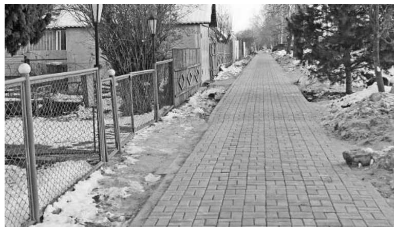
Тротуар по ул.Ленина построен по программе поддержки местных инициатив.

По Указу Президента РФ в 2020 году была выделена субсидия более 5 млн руб. на капитальный ремонт